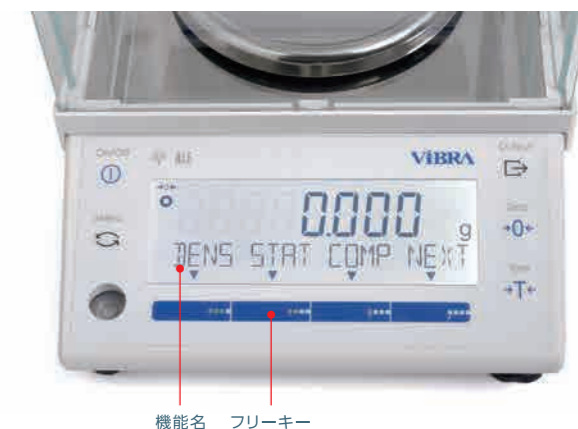
機能名 フリーキー

【登録できる機能】グロス/ネット切替・日付表示・時間表示・風袋値表示・上限値表示・下限値表示・IDナンバー表示・単位設定g・単位設定mg・単位設定ct・内蔵分銅によるスパン調整(Rタイプのみ)・外部分銅によるスパン調整・加算・合計値表示・ホールド・GLPヘッダー印字・GLPフッター印字・最小表示切替・応答速度設定